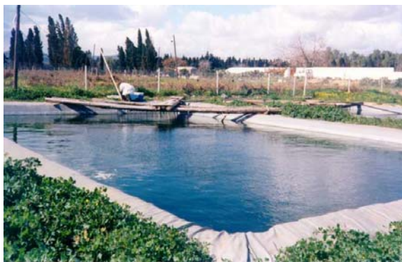
Bassin de stockage expérimental de la station de recherché de l'INRGREF à Nabeul Le filtre à sable

d'irrigation (mai à septembre). Les petits réservoirs aménagés par les fermiers jouent dès lors le double rôle de régulation et de traitement complémentaire.