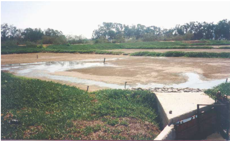
Station de Ben Sergao, traitement secondaire des eaux usées domestiques de la ville d'Agadir (Maroc) par infiltration-percolation

Enfin, les deux recommandations supplémentaires qui peuvent s'ajouter à cette étude sur la réutilisation de l'eau usée traitée par infiltration-percolation sont que l'usage mixte de l'eau usée traitée et l'eau de puit dilue le taux de sel et les concentrations en nitrates et que le procédé de traitement peut être amélioré en y ajoutant une étape de dénitrification, tel que le projet pilote de Darga l'a démontré.