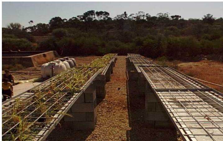
Essais d'épuration tertiaire par Epuvalisation à Chypre

la qualité de l'effluent. Aucune réduction significative de DBO, pH et conductivité électrique n'a été observée. La réduction des teneurs en nitrates facilite une réutilisation non restrictive de l'effluent produit, et dans le cas de réutilisation par irrigation, la réduction des solides en suspension est capitale pour la diminution des risques de colmatage des systèmes d'irrigation localisés.