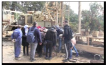
Visite du forage de Chebli à plus de 430 m de profondeur

Des stages pratiques sur terrain réalisés sur des chantiers de barrage, de périmètres d'irrigation, au niveau