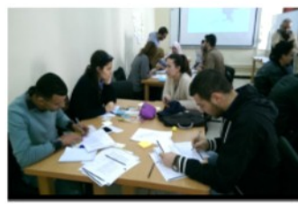
Animation du Workshop ANSEJ. BLIDA

Dans le cadre de la Formation Ingénieur Entreprendre (FIE), l'ENSH a organisé en collaboration avec l'Agence nationale de soutien à l'emploi des jeunes (l'ANSEJ) des séances de brainstorming et une journée de formation animée par des responsables et des experts en management et marketing, aux profits des étu-