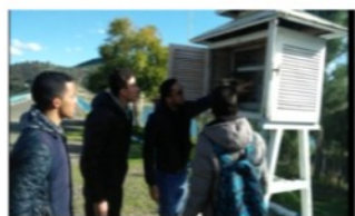
des ouvrages hydrotechniques. Visite du Barrage